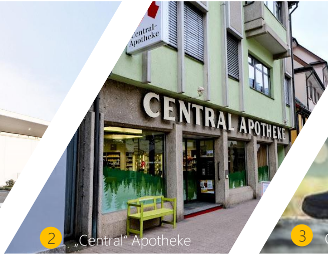
2 „Central“ Apotheke