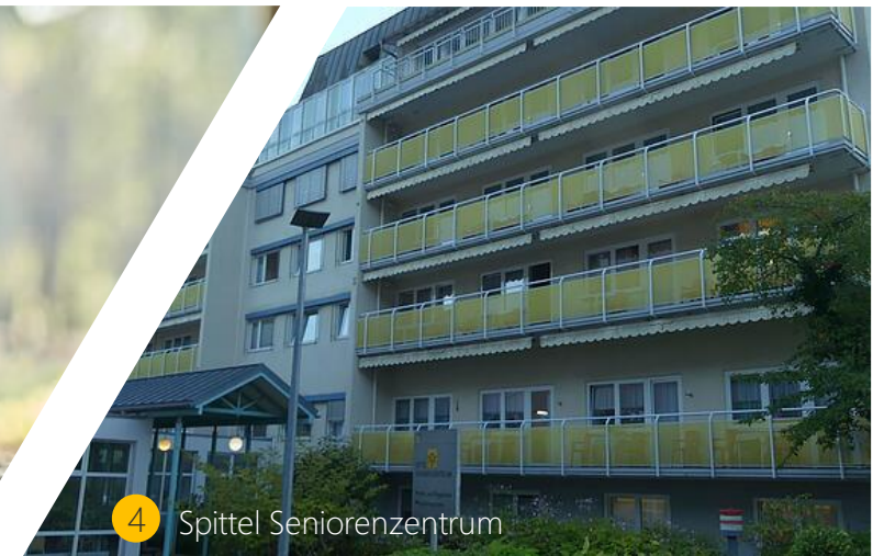
4 Spittel Seniorenzentrum