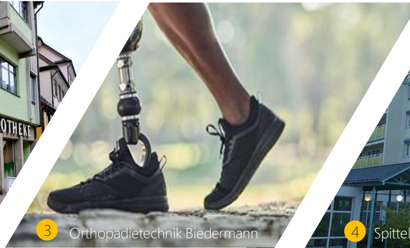
3 Orthopädietechnik Biedermann