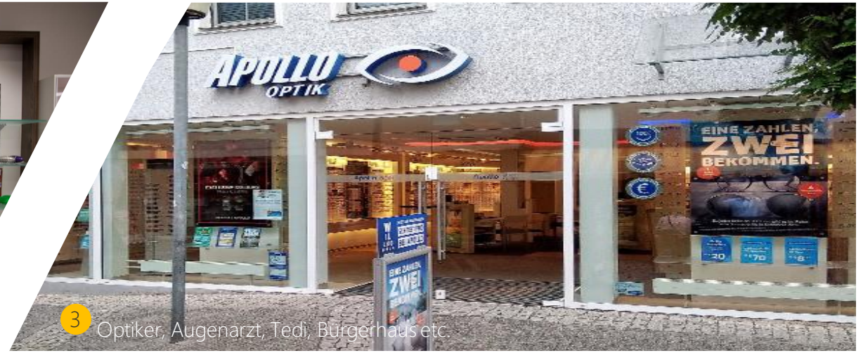
3 Optiker, Augenarzt, Tedi, Bürgerhaus etc.