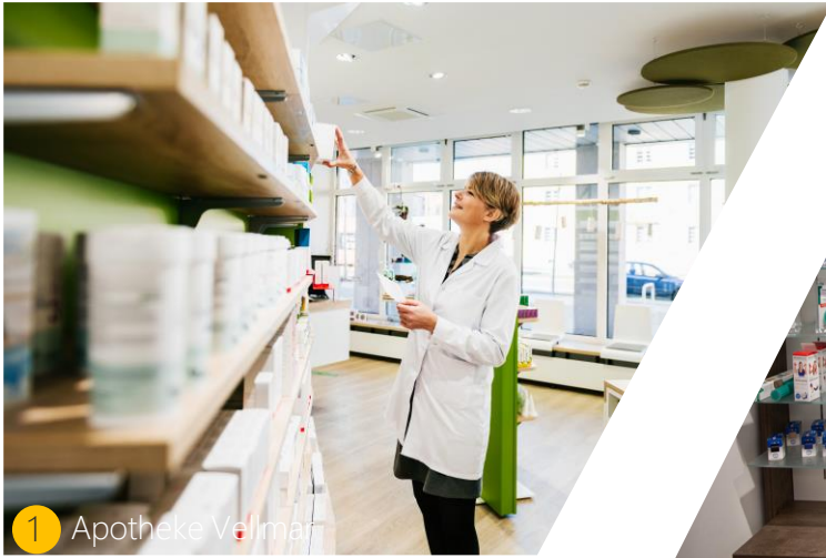
1 Apotheke Vellmar